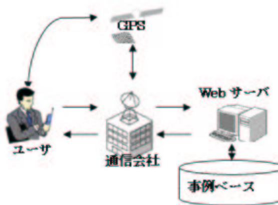
図2 携帯端末を通したプランの変更

しかも、地図で観光地間の距離によって、移動手段を選択してから、経路の総所要時間と費用も示すことができる。生成したプランを事例ベースに保存する。図2にこの仕組みを示す。