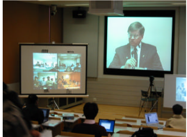
図 3. 当日の様子(慶應義塾大学)

各サイトとも同様の構成となっており，講師の映像が中央スクリーンに投影され，各サイトの映像がサイドのスクリーンに投影されていた．当日は SFC に約 30 名，東京大学・倉敷芸術科学大学・奈良先端科学技術大学にそれぞれ約 10 名が集まり，各サイトからの発言があり，活発な質疑応答がなされた．