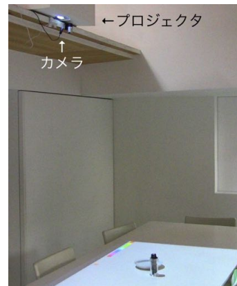
図 2: 実験住宅に設置したシステム

このシステムのために、後述する調味料容器型インタフェースデバイスを開発した。食卓に座ったユーザは、調味料容器型デバイス进行操作して料理やテーブルの上に色をつけたり、文字や絵を描くことができる。