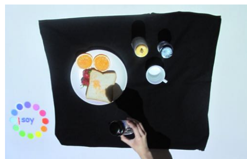
図 4: 本システムを投影した例

色を投影する場所の特定には、調味料デバイスに取り付けられた赤外線 LED の光を利用する。この輝点を赤外線カメラで取得し、撮影した画像の輝度値が適切な閾値以上である場合、LED の場所と判断し、デバイスの座標として PC に値を送信する。