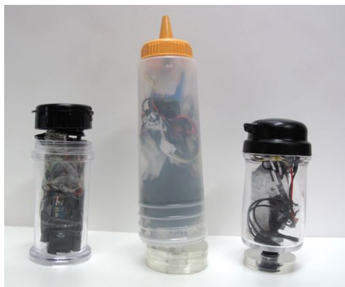
図 3: 調味料容器型デバイス

色をつけることができる。これによりユーザは、調味料容器のメタファから得られる手がかりを利用し、わかりやすく直感的な操作を行うことができると考えた。