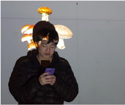
図 2. スマートフォンを構えると、きのこが生える

人が立ちながらスマートフォンを見る際、ほとんどの人が手と肩の位置が肘よりも高くなることを利用している。