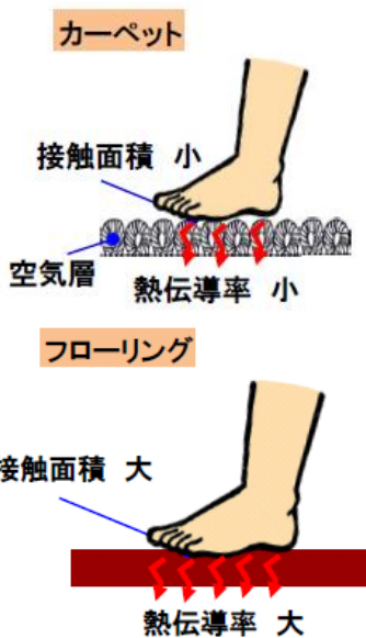
図2 足が感じる暖かさや冷たさ