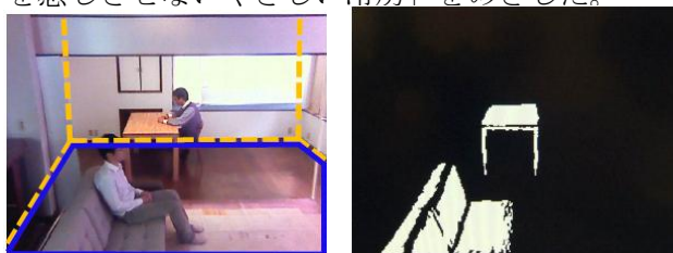
床面の範囲を検出

従来の「可視光カメラ」と「サーモパイル」に加えて「近赤外線カメラ」で構成する「くらしカメラ4」により、人の位置・活動量やその周囲温度、ソファやテーブルといった家具の位置や形状などに加えて、新たに床の種類を判別し、さらに天井の温度や下がり壁まで検知することで快適な空調を実現する。屋内で靴を脱ぐという日本の生活習慣と床の表面温度が同じでも床の種類によって「接触温冷感」が異なることに着目し、「フローリングでも素足で過ごせる暖房」を、また冷房時は輻射熱など室内の潜在的な課題と「冷房の風が直接当たって不快」という不満にも配慮し、室内環境を踏まえた「気流を感じさせないやさしい冷房」をめざした。