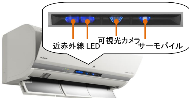
図 1 エアコンに搭載したカメラ

ここでは 2015 年度発売の「白くまくん Xシリーズ」のセンシング技術を駆使した気流制御技術について述べる(図 1)。