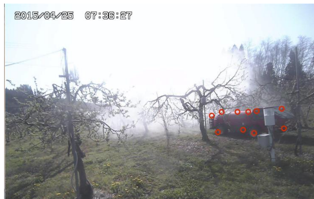
図3 パターン認識による特徴点抽出画像の例