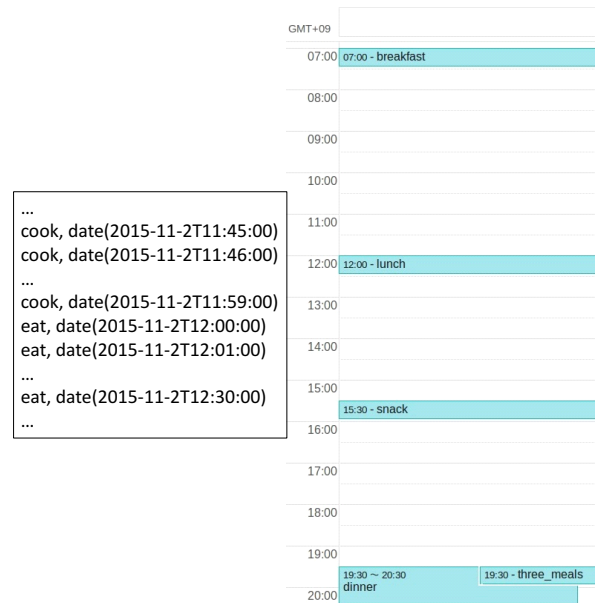
図 3: イベントデータ例とカレンダー例

レンダーには、7時から7時30分まで朝食、12時から12時30分まで昼食、15時30分から15時40分まで間食、19時30分から20時30分まで夕食を食べたこと、およびその1日に朝食、昼食、夕食の3食を食べたという情報 (three_meals) が追加されている。