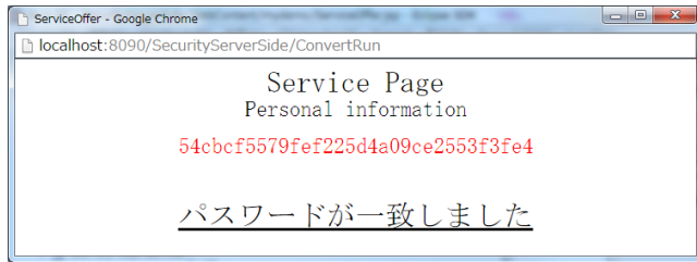
図 5 パスワードの認証結果