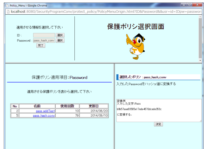
図 4 保護方法選択のためのユーザインターフェース

TTP が提供する保護方法選択ページの例を図 4 に示す。図 4 の左上のフレームには利用者側のアドオン (後述) により解析された利用ポリシーの一覧が表示される。すなわち、利用者が個人情報入力画面で要求されている個人情報の一覧が表示される。図 4 はサービス利用時に ID とパスワードを要求するサービスに対する例であることを示す。ここで、ID/Password の横に配置された選択ボタンが押されると、選択された個人情報に対して適用可能な保護ポリシーの一覧が左下のフレームに表示される。保護ポリシーは TTP 内の保護ポリシーデータベースで管理されており、MySQL で実装されている。一覧の中の保護ポリシーをクリックすると、その保護ポリシーが個人情報をどのように保護するものであるかが右下のフレームに表示される。利用者はこれを