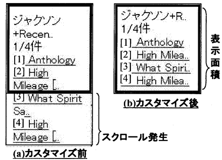
図 3: 機種ごとのカスタマイズの効果

そこで、クライアントが送信する機種情報を、サーバ側で取得し、機種ごとに操作回数保証型検索方法の「最大メニュー幅」を変える。また、表示する検索結果ページの各行を、機種ごとの「一行の表示文字数の最大値」を上限として切り捨てる。この切り捨ては、CD の検索結果のアーティスト名やタイトル名のように、文字列の先頭の一部さえ表示すれば、その文字列が示しているものをたいてい想像できるという特徴を利用している。これにより、クライアントの表示環境が異なる場合にも、数回の最大絞込み回数以内で、必ず検索結果を一画面に収めることが可能となる(図 3(b))。