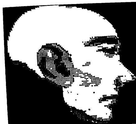
図 2 復元した顔 (出力) Fig. 2 A restoration face (output).

いか否かをディスプレイから人が観測する。修正はタブレットを用いる。それが終了すれば OK をキーインする。今回配慮したのは、眉・眼・口・鼻・耳の五つである。髪も同時に行える (図 1, 図 2 参照)。