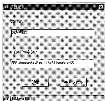
図 3. カスタムコンポーネントの登録

図 3 は、Java のクラスとして実装された CC を、BC に登録する画面である。