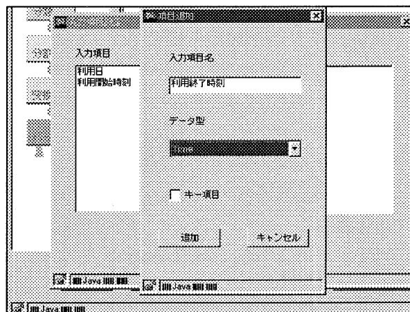
図 4. 入力項目の設定

機能が付加された場合でも、それを実現する CC を実装し、それを登録する BC をモデルに追加することで、アプリケーションの処理の中に容易に、その機能を組み込むことができる。