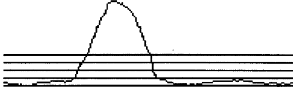
図2 分散, 自己相関値の区間わけ

各区間に何回の信号が出現しているかをカウントする。そして最も多く出現した区間を雑音の主要な大きさを表す区間とし、該当区間に出現した信号の和を信号の出現回数で割った雑音の平均値を分散値についての物 \bar{n}_\sigma と自己相関値についての物 \bar{n}_c それぞれに定める。この時大きい値については鳴声によるものとみなし計算から除外しておき前提とした鳴声よりも雑音のほうが多いという条件から外れている場合でも対応できるようにした。