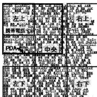
図 1. テストページと画面分割

ゲットの位置は図 1 に示す 5 種類 (左上, 右上, 中央, 左下, 右) とした。キーワード探索のしやすさがこのターゲット位置によって左右されるかどうかを調べる目的がある。図 2 に携帯 FB の一画面例を示す。端末および FB によって多少差はあるが、携帯ではおよそ 14 文字×12 行、PDA では 21 文字×17 行が一画面に表示される。なお PC ではテストページは一画面に収まる。