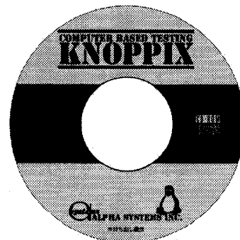
図 1. CBT-KNOPPIX の CD ラベル

本稿では、前述の KNOPPIX の特徴を活かし、適切なカスタマイズを行うことで、CBT のセキュアなクライアント環境を提供できると考え、KNOPPIX 日本語版をベースにセキュリティに重点を置いてカスタマイズした CBT-KNOPPIX を開発した。