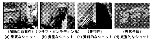
図1: 繰り返し利用される映像ショットの例

像の一つとして、トピックに含まれる同一映像ショットを抽出する方法を提案する。ただし、ニューストピックの概要を把握できるようにするためには、対象のトピックのみならず、そのトピックに関連するトピックの内容も同時に表現できることが望ましい。また、同一映像ショットの数は多くないため、単一のトピックに含まれる同一映像ショットが抽出できない場合も考えられる。そこで、キー画像の取得に際しては、トピック構造において、対象のトピック(主トピック)から派生するトピック群(トピッククラス)に含まれる同一映像ショットを抽出することとした(図2)。