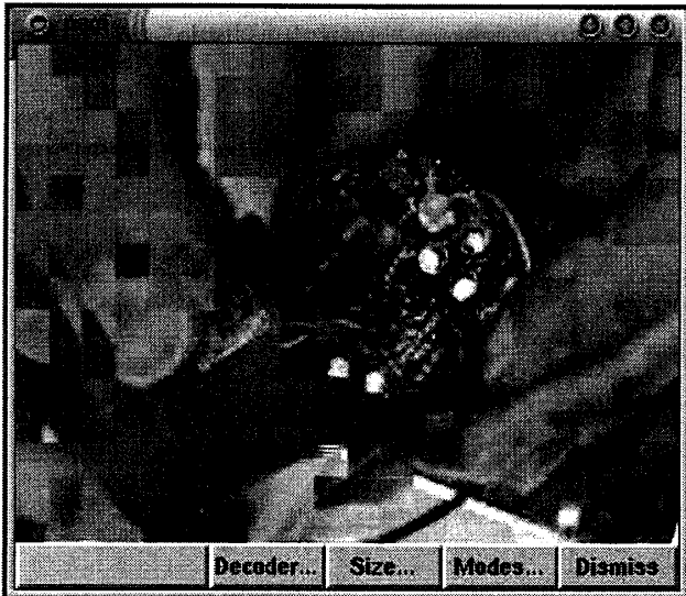
図2 優先度付与しない場合