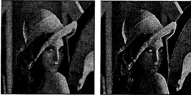
(c) WM filter (d) Proposed filter( \alpha = 3 )