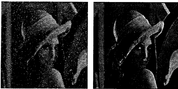
(a) Blur & Impulse (b) Proposed filter( \alpha = 3 )