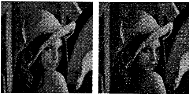
(a)Original image("LENA") (b)Degraded image(salt 2%)