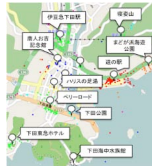
図4. 不要写真を除去したInstagramにおける上位POI