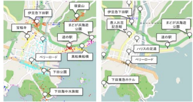
図3. 下田エリアでの上位10位までのPOI

そこで、Instagramから得られた16,356枚の写真群から、観光情報源として用いるには不適切な写真を人手で選別した。選別の条件は文献[5]に準じたが、観光情報源に適しているが位置情報が不正確な写真も不要写真として判定した。また、判断困難な写真は不要写真に算入している。選別の結果、非不要写真は9,295枚(56.5%)となり、約半数は観光情報源として不適切な写真であることが確認された。不要写真を除去して抽出しなおした上位POIを図4に示す。