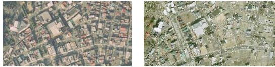
図1 震災前の航空写真 図2 震災後の航空写真