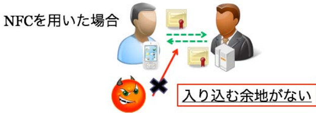
図2：NFCを用いた中間者攻撃対策