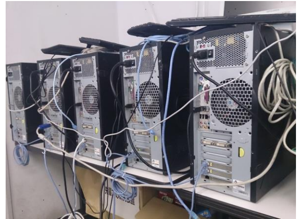
図2 OpenFlow機器として使用したPC

図3のようなトポロジでコントローラとスイッチを接続し、経路の制御を行う。コントローラおよび各スイッチは図2のような標準的なデスクトップPCにNICを増設したものを使用する。コントローラおよびスイッチの仕様は表1の通りである。各PCはオープンソースのソフトウェアをインストールすることでコントローラおよびスイッチとして動作する。コントローラにはRyuを使用し、