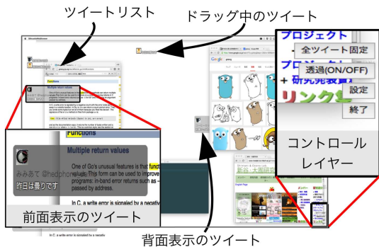
図 2: 実行例