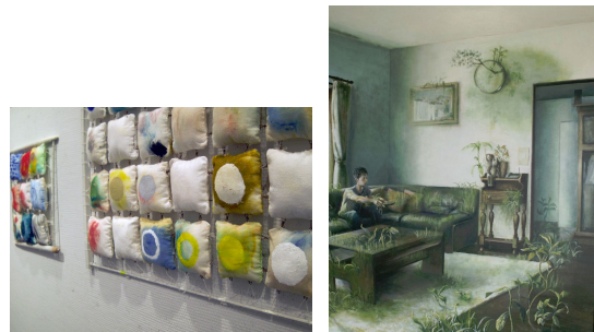
図1 投影した作品の写真 作品A(右), 作品B(左)

鑑賞対象: 今回は、長岡造形大学の2名の学生が製作した芸術作品の写真2枚を対象に行った。被験者には2枚の写真を一枚ずつ見てもらった。見ってもらう写真は製作者自身に撮影してもらい、その作品に対する解説文が写真の下に書かれている写真と、書かれていない写真の2種類を用意した。被験者には解説有りとして解説無しとのどちらかを見てもらった。また、2枚の写真を見せる順番はランダムにした。作品解説があった場合はそれも合わせて読むように指示を行った。鑑賞時間は、作品解説有りの場合は100秒、作品解説無しの場合は60秒とした。実験時間は一人につき30分程度であった。実験日時は2015年6月の中旬であった。図1は投影した写真である。