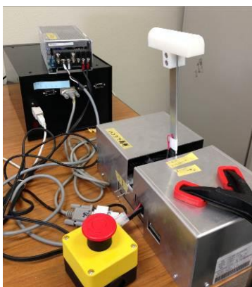
図1 力覚提示デバイス (1自由度)

そこで本研究では、遠隔地にいるオペレータがインターネットを介して他者と互いに力覚を共有した場合の力覚提示効果を検証し、この力覚提示デバイスの今後の応用例を検討することを目的とする。また、力覚提示効果を検証する為、操作が簡易的で、1自由度の移動により実現可能であり、機械・ユーザの安全のためスピードや過度な力を要求しないネットワークゲームを開発する。