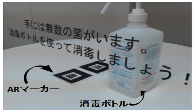
図4 システムインターフェース (スタンバイモード)

獲得され、ユーザの消毒行為に対する興味・関心を高めることに結びついた。図4と図5には、本研究で開発したVer.3を示している。