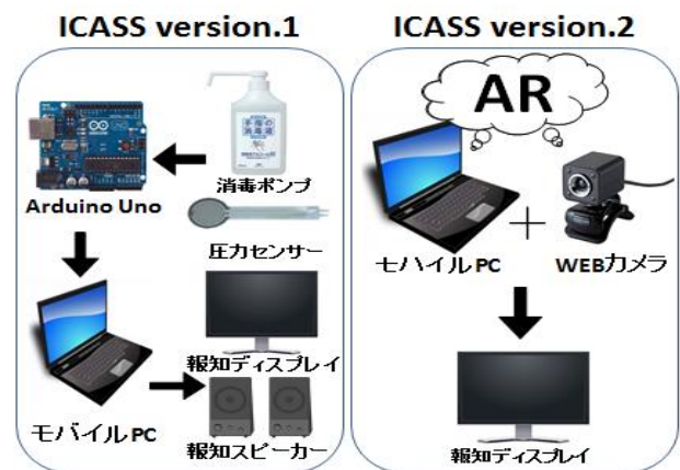
図 2 先行開発の ICASSver.1 と ICASSver.2

2013 年には ICASS(Infection Control AR Support System)ver.2 として、AR(拡張現実)技術を用いてユーザの手指消毒行為の興味関心と参加しているという意識を高めるための機能を開発実装した。ver.2 は安価でシンプルな導入を推進するため、圧力センサーや光センサーなど高価で複雑な技術は排除した。ver.2 はモバイル PC と WEB カメラのみというシンプルな構成であるが音声報知は使用していない。カメラが検知したユーザの手のライブ画像に動的なウイルスピクトと星形ピクトを重畳表示する機能を有しており、ユーザは参加しているという意識を高めた。検証では公共の場に設置して一定の評価を得た。