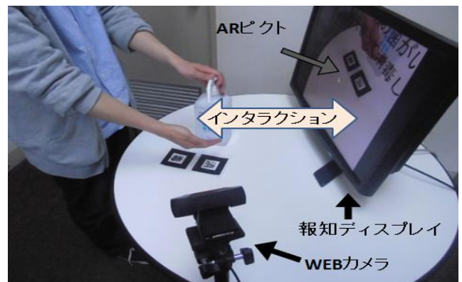
図5 消毒行為環境 (システム設置の様子)