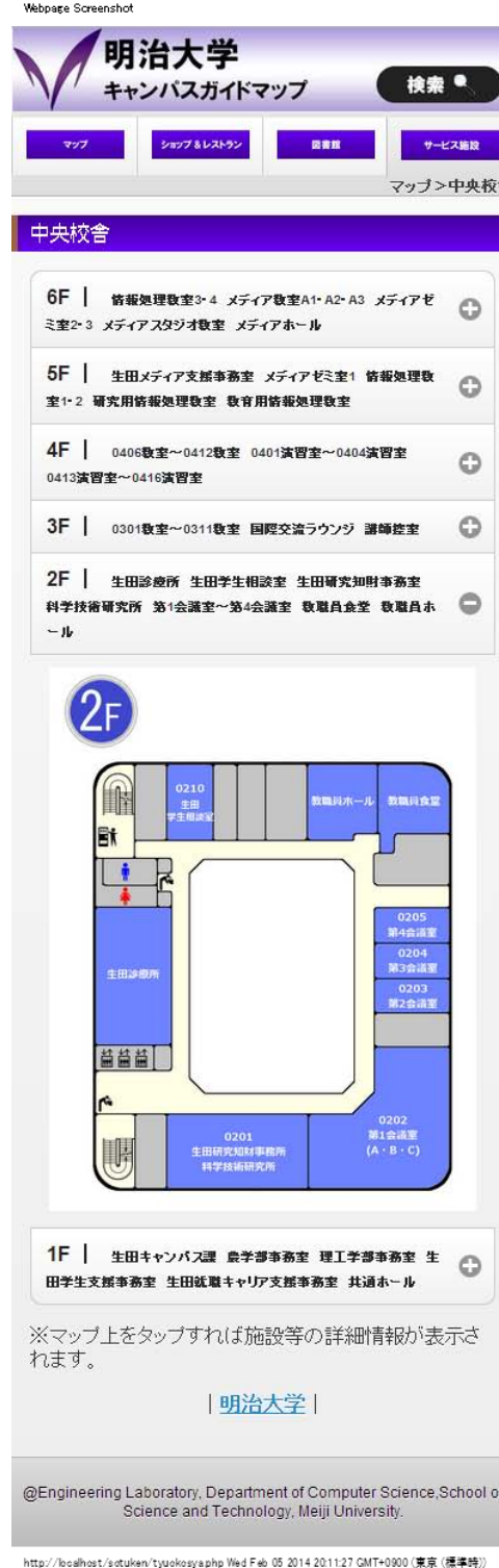
図3 フロアガイドマップ

図書館については、既存の明治大学公式Webアプリ(iMeiji)で、新入生や来訪者向けの情報提供が行われているので、そのサイトへのリンクを付けることで対応することにした。