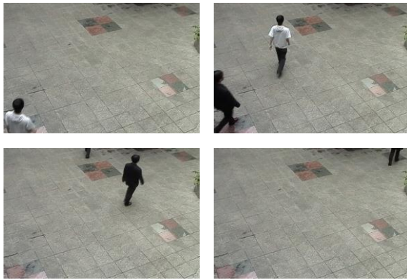
図 2: 実験の対象の動画像