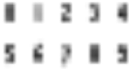
図1 低解像度平滑化画像( W = 8, m_0 = n_0 = 0, r = 4 )