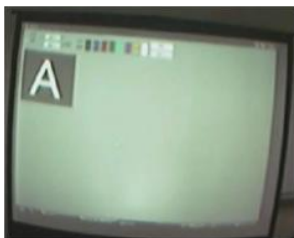
図3. フィッティング風景

我々が目標とする補視器は、視認の向上を目指すものであり、眼科的な識別能力や感度分布とは異なる指標にある。それは、弱視者の可読領域とも呼べるようなものであり、最も視認できて無理なく理解できる位置に表示部分を置くという考えで、補視器のフィッティングを行なっている。図3は、PCを用いたフィッティング風景である。ディスプレイに表示された(単眼シースルーディスプレイも、同画面が表示されている)文字が読めるか否かを測定する。同図において、弱視者が“A”と答えられれば可読領域にあると判断する。また、補視器は、視線追跡装置のような瞳孔解析を行なう必要はないので、眼球振動のある者でもフィッティング作業を行なうことが可能である[1]。