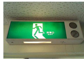
図4. 視野領域の部分拡大

我々が考える両者の大きな違いは、視線追跡装置は未知環境向き(情報探索型)であり、補視器は既知環境向き(情報提示型)となっていることである。例えば、教室で講義を受ける際に、黒板の方向は分かるが、視認が困難であるときなど、求める対象が明確である場合に効力を発揮する。補視器は目の前に置かれた拡大鏡付きディスプレイであるので、電子白板と組み合わせれば、講義内容の配信も得られる。図表の提示やPDFの文書など、映像信号源であるPCと繋げて、ネットワーク経由で膨大な資料も提示できる。また、歩行中での地図情報の提供など、電子的な視覚情報の保障に対して大幅な向上が期待できる。