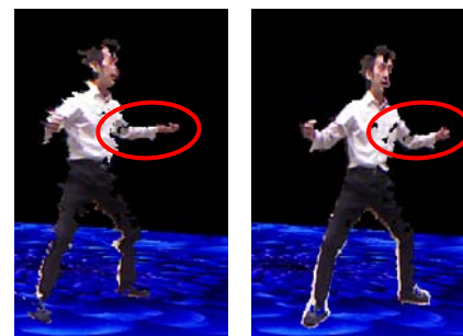
(a) 提案手法 (b) 比較手法 図 4. 仮想視点 3 における合成結果