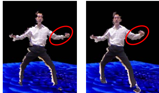
(a) 提案手法 (b) 比較手法 図 2. 仮想視点 1 における合成結果

きポリゴン化し 3 次元形状モデルを復元することで、仮想視点において、オクルージョン再現の観点でより自然なレンダリングが可能であることを示した。今後は、複数カメラ間の情報を統合することで、オクルージョンにおけるテクスチャの補間について検討を行う予定である。