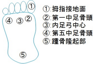
図 2: 測定位置

ロリー消費量を取得した。足圧の測定には Elf-System [7] を使用した。図 2 にセンサーの取り付け位置を示す。図 2 のようにセンサーを取り付け、速度を 5km/h, 7km/h, 9km/h, 11km/h に設定して、2 分間ずつ足圧データの測定を行った。