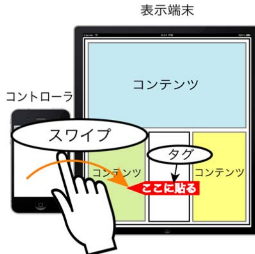
図 3: タグやテロップの送信例

通信手段は、Wi-Fi もしくは Bluetooth を用いる。Wi-Fi 接続が可能な状態では、Wi-Fi によってピアツーピア通信を行う。Wi-Fi 接続が不可能な状態においては、Bluetooth 通信を行うことでローカルエリアでの使用が可能である。コントローラからは表示端末に対してテロップやタグの情報を送信し、表示端末からはコントローラに対して自身の端末情報とスワイプされた時刻を送信する。