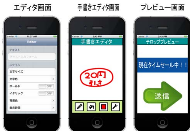
図 2: コントローラ画面例

ユーザが入力したタグやテロップの情報、各表示端末へのテロップやタグの送信内容を記録する。送信先決定モジュールはマルチタッチインターフェースを利用し画面をスワイプすることで、送信先端末を決定するためのトリガとなるモジュールである。通信モジュールは、コントローラと表示端末において Wi-Fi もしくは Bluetooth を用いてアドホックなワイヤレスネットワークを設定し、ピアツーピア通信を行う。