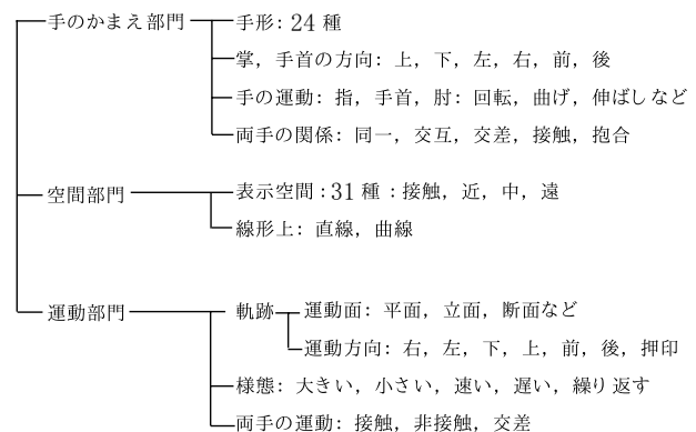
図2: 日本手話音韻表記法における手話の構造

を用いた。音韻の種類・出現頻度の調整方法については、先行研究で発表されている音韻表記法 [3] に基づき音韻の分類を行い、出現頻度を調整した。図2に音韻表記法における手話の構造を示す。