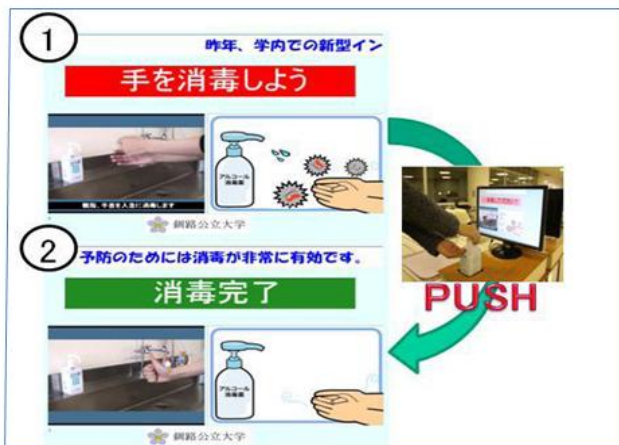
図3 システムインターフェース

更に、システムで使用しているボトルの規格は容易に取り換えることができ、インフルエンザ以外の感染症にも対応することが可能であり、非常に拡張性が高いと言える。