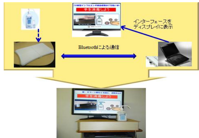
図1 感染予防支援システムの構成

システムは①バランス Wii ボード②モバイル PC(開発アプリケーションを導入しているもの)③モニター④Bluetooth 受信機で構成されていて、本研究で開発したアプリケーションは Microsoft .NetFramework3.0, C#言語を使用している。システム構成は図1のようになっている