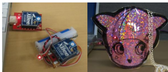
図4 盛り上がり表示無線機器

図4に今回試作した無線機器部の内部（左）と外観（右）の写真を示す。無線機器部は盛り上がり表示部の受け取った検知信号を、無線機器ユニットを介して受信し、PWM 制御により LED 点滅/消灯信号へと変換し、盛り上がりを表示する。これによりユーザは、PC から離れていても盛り上がりを知ることができる。