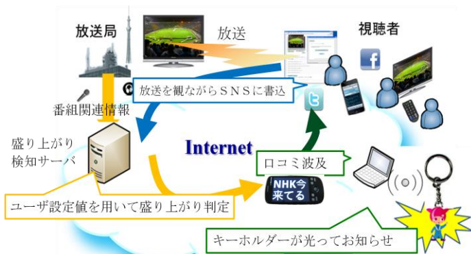
図1 テレビ視聴誘発システム概念図

図1に提案するテレビ視聴誘発システムの概念図を示す。提案システムのターゲットユーザとして、ロジャースの普及モデル[3]におけるアーリー・アダプターを想定する。若年層に多いアーリー・アダプターは、目新しいものを好み、ロコミ波及効果が高いと言われている。これらのユーザは、自分と同じコミュニティのユーザの発信する情報を信頼し、購買や行動が流動的に変化しやすいと言われている。テレビを見ながら番組に関する意見や感想を、Twitter[4]などのSNS (Social Networking Services) を使いリアルタイムで投稿する視聴者なども、この部類のユーザの行動といえる。提案システムでは、これらの番組に関する意見や感想を収集し、ユーザ発信の入力として使用する。サーバ側では、放送番組に関するコメントを収集し、番組概要や字幕情報などの関連情報を用いて入力コメントを解析・蓄積する。更に、コメント数の単位時間当たりの増減値を常時カウントし、ユーザの設定した閾値を超えた場合、その期間を「盛り上がり」ポイントとみなす。提案システムに登録しているユーザの端末は、常駐アプリケーションにより盛り上がりを検出することとした。一般的な「盛り