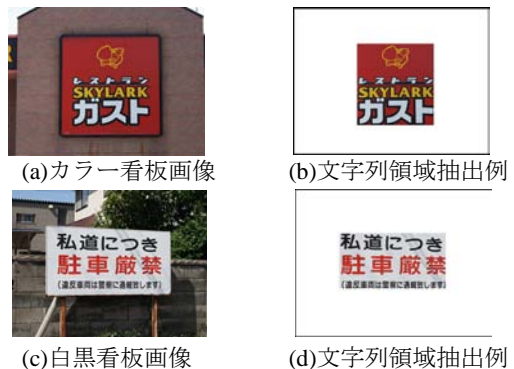
図3 提案手法による結果例