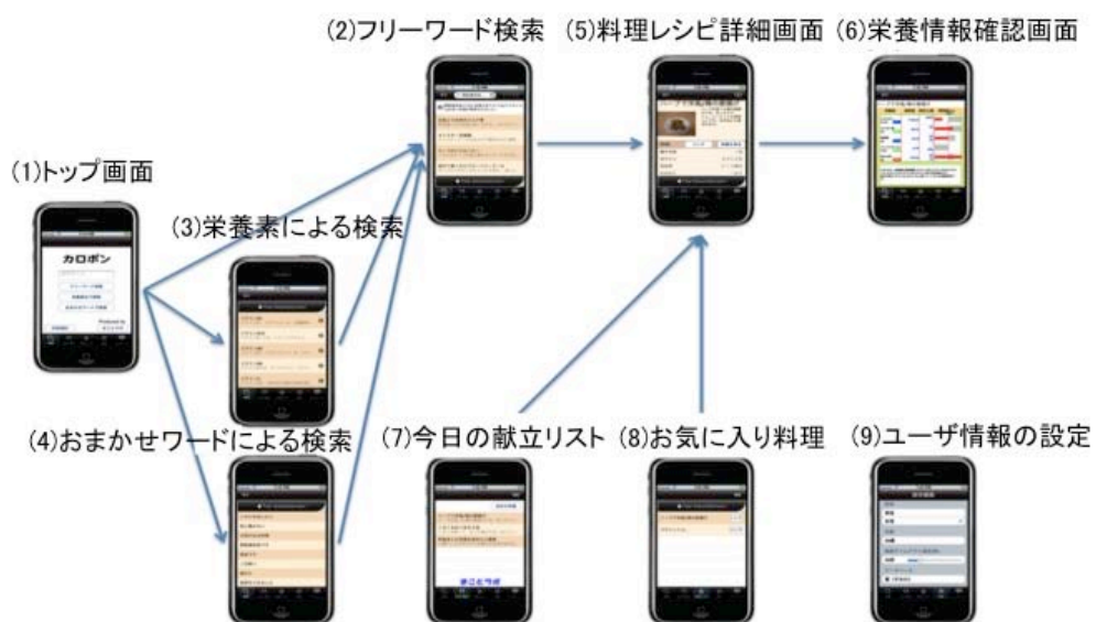
図2 システムの画面遷移図

図4は、栄養素をグラフ表示している画面である。栄養摂取基準をもとに、達成率がグラフ形式で表示される。達成率が100%以上のデータに関しては、100%として表示している。尚、表示に用いている栄養摂取基準は男性で20代の場合である。図4からわかるように、目的の栄養素を