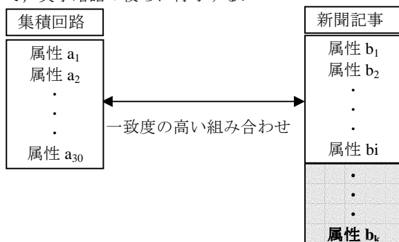
図3 「集積回路」と新聞記事での関連度計算

選出した a_1 から a_{30} と b_1 から b_i との間で関連度計算を行い「集積回路」と新聞記事との関連性を定量化する. この手法をそれぞれの意味候補で行い, 最も関連度計算結果が高いものを記事内における英字略語の適切な意味として, 英字略語の後ろに付与する.