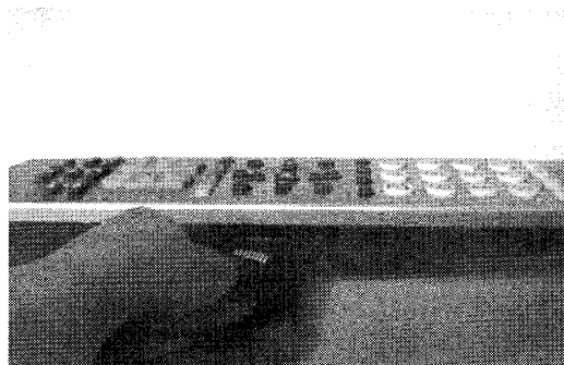
図 1. 操作ログを記録するリモコン

実生活で使用している TV に対応し、日頃の操作感ができるだけ変わらないように考慮し、多くの TV メーカーのリモコンコードが予め登録されている市販のプリセット型リモコンを利用することとした。また、ログを記録するために、日付を得るための時計とメモリ (microSD カード) を装備した (図 1)。1 回の操作につき、日時と、コード化された操作内容をログとして記録する。これらの改造は、ユーザのリモコン操作に影響を与えることはない。