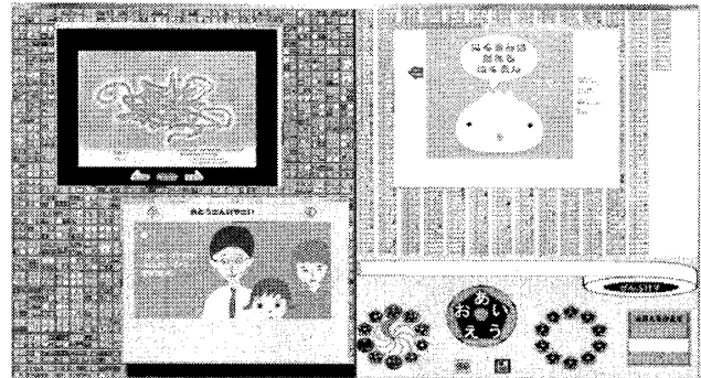
図1. ブラウズリーダで探し当てた3冊の絵本を一般リーダで読んでいる様子

冊子体絵本と調和を保つために、ウェブ絵本の見せ方および扱いは冊子体絵本を参考にして統一化する。冊子体絵本に近い見せ方は子どもにも好まれる見せ方であり[7]、調和が保てるだけでなく子どもにとってよい読書環境を提供できる。