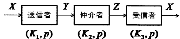
図1:提案する暗号系を用いた情報の変換