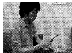
図1 本システムの使用例

対象となる実世界上のオブジェクトを撮影する。この場合、閲覧対象となるコンテンツは、携帯電話のディスプレイ上で、