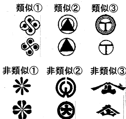
図3: 評価実験で用いる画像[8]

画像特徴のみによって得られる類似度と、画像特徴と印象特徴から得られる類似度を比較した。実際に審決が行われた商標(図3)を対象とした。類似と判断されたものが3対、非類似と判断されたものが3対である。