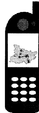
図2 携帯電話での経路検索画面表示のイメージ

情報提供機能は、目的地で検索を行うと、同時に目的地で現在行われているキャンペーンや、歴史等の、その場所の情報を得ることが出来る機能である。目的地の場所の情報を深く知ることが出来ると同時に、お店のセール情報やイベント情報を知ること、その場所に来た人たちにより多くお金を使ってもらえる可能性が生まれる。また、同一コンテンツ内で、目的地までの経路も調べることが出来れば、個別にナビゲーションアプリを起動する必要なく、目的地までの情報を得ることが出来、利用促進に繋がる。今までこのシステムを利用した履歴を表示し、どのように観光を行ったかを画面で確認出来るシステムも考えられる。また、より多く利用することで専用ポイントが貯まり、ランキング等で競わせたり、位置情報を使い、システムの利用者同士でのチャットルームを提供する等のコミュニケーション機能を提供することなどが考えられる。しかし、これらの機能は、観光客の行動がこのシステムを利用することで変化を与えてしまうことが考えられ、調査のデータの正確性を損なう可能性があることを考慮しなければならない。しかし、現実問題として、実用上、本人に何も利点のないシステムを使い続けてもらうことは謝礼があったとしても難しいと考えられ、利用者を増やすため、機能とデータの正確性のバランスを調整する必要がある。