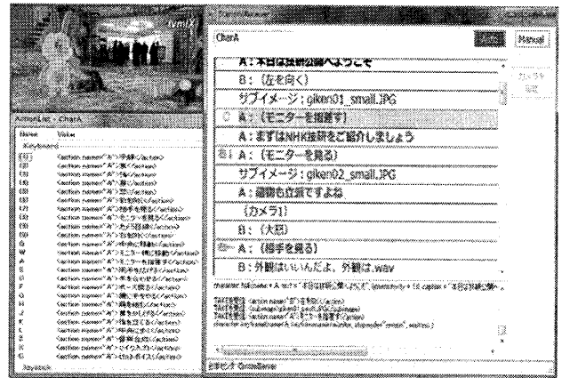
図3 制作ユーザの操作端末の表示例

スクリプトストリーミングサーバは、ネットワークアドリブシステムから送信されたTVMLスクリプトを、他のクライアントへ一斉に転送する。各制作ユーザの手元にあるTVMLプレイヤーがこれを受信し、リアルタイムに番組再生を行う。