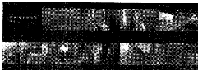
図 5: アクション映画のシーン例

の音楽セグメントから編集者が適切と思われるものを1つ選択した。表5に被験者の評価結果を示す。