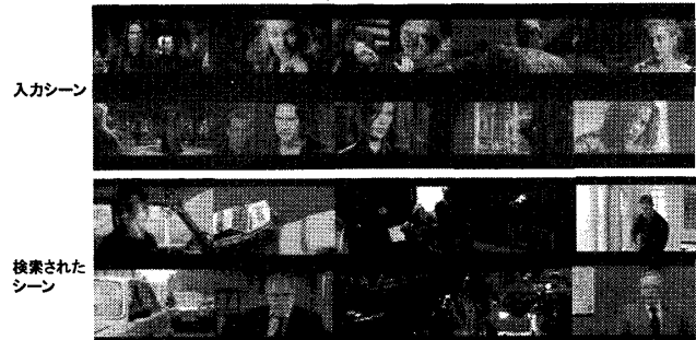
図 4: シーン検索の失敗例

した映像には特性が類似した音楽が付与されており、提案手法によりそれを模倣することが可能であるといえる。