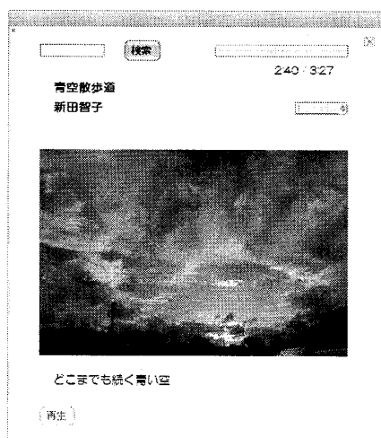
図2 デモアプリケーション画面