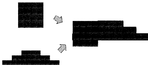
図2. テクスチャの結合

周囲情報に対しては、まず、家屋構造記述言語から周囲情報で使用している家屋部品コードの一覧を抽出する。次に、コードの一覧から重複を取り除く。最後にコードで表現された部品とテクスチャの対応を基にして、テクスチャの一覧を生成する。その際、共通部分をもつ部品は図2のように手作業でテクスチャを重ねて一枚のテクスチャとすることでテクスチャサイズを節約する。