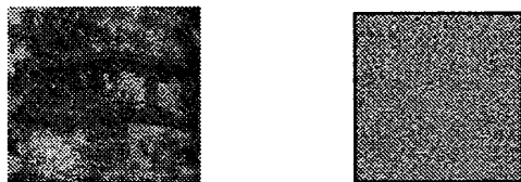
(a)キー画像 mone14 (b)キー画像を微分した画像 図1 実験に使用したキー画像

絵画画像のサンプル画像として似ている作風の多いモネの「睡蓮」を中心にルネサンス期, バロック期, ロココ期などから 119 枚を用いた。モネの「睡蓮」の絵画を 15 枚収集した。画像のサイズは 190×183~621×600 である。実験では比較的程序で操作しやすい PPM という画像ファイル形式を使用する。収集したモネの絵画画像は mone1 から mone15 までの名称を付けた。