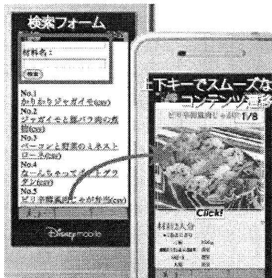
図 1: 本レシピ検索システムの実行例